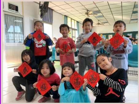
一甲 期末贈春聯活動