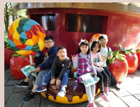
二甲 校外教學--九族文化村