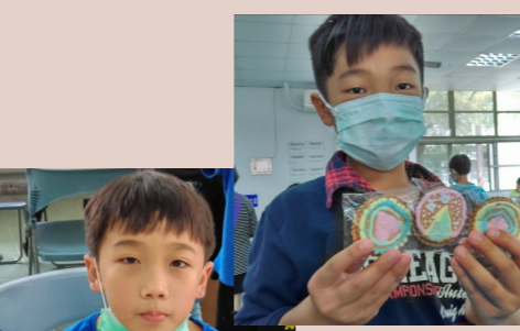
四甲 秉軒-彩繪餅乾