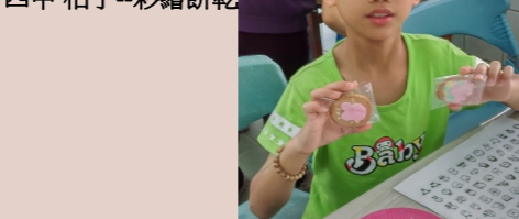
四甲 濯淪--彩繪餅乾