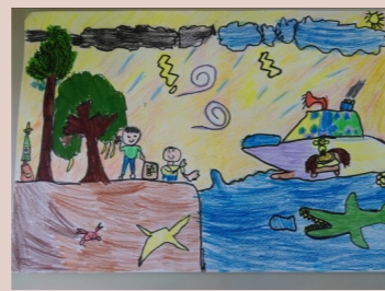
四甲 濯淪--到海邊玩

這本書讓我發現我應該學習她的精神，承認自己有限的能力和弱點，明白自己可以做多少事，並以一種堅定的心努力完成它。