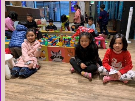
一甲 上學期表現優良的同學

嘉義縣朴子市農會 銀行代碼：617 分行代碼：0024 學校專戶帳號：00024160094411