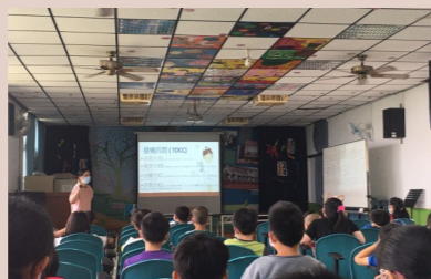
健康中心新冠病毒防疫宣導