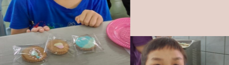
四甲 柏宇--彩繪餅乾