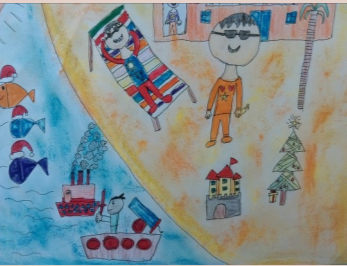
四甲 柏宇--渡假飯店