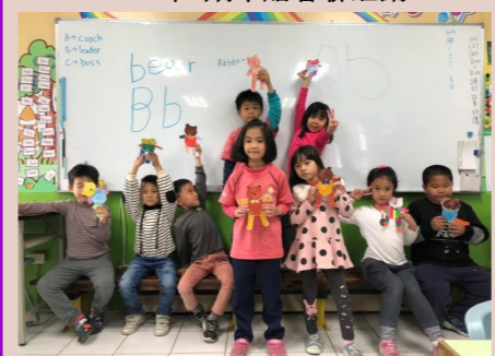
一甲 創意英語教學