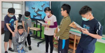
六甲 演戲-橘化為枳