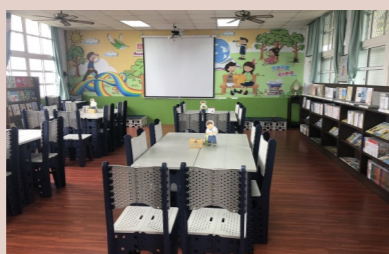
更寮國小靜思書軒成立