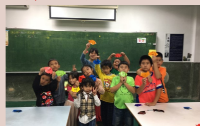
親師日兒童紙藝活動