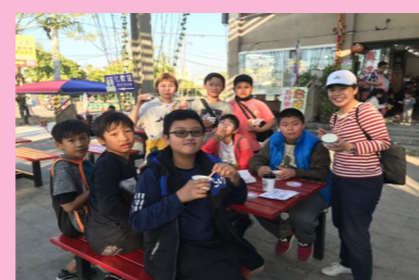
直笛隊「藝騎踏查趣」