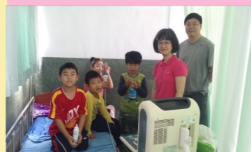
三甲 長庚脂肪肝健檢