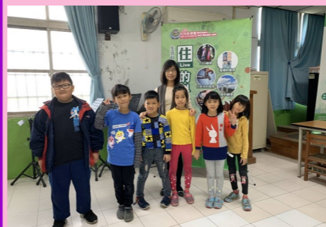
二甲 研揚科技——住的應用