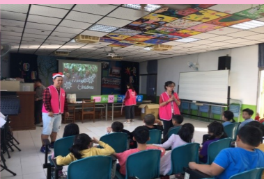
豐穗基金會致贈聖誕禮物