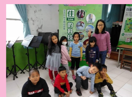
一甲 住的科技應用