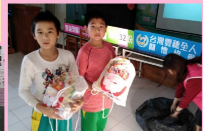
五甲 感謝豐穗送聖誕禮物