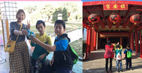
五甲 社區自行車之旅

小黑是我的好夥伴，相處的那段時間裡，我們總是分享彼此的喜怒哀樂，現在牠不在我的身邊，希望牠的新主人能像我一樣的照顧牠，我會一直記得牠—小黑。