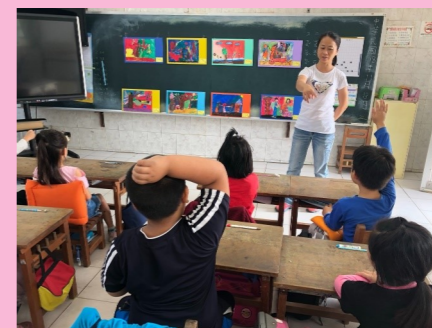
一甲 觀課-藝術鑑賞教學