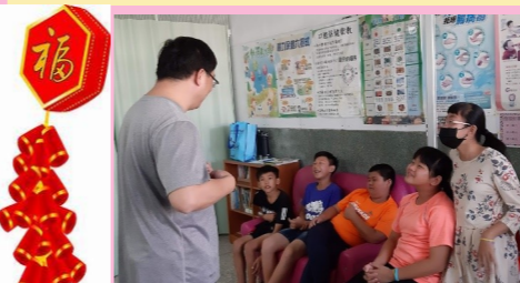
六甲 肝功能檢測-醫師開講

中國歷史五千年這套書製作精美，還彩色圖片、地圖，引起我對歷史故事的興趣，不但故事內容吸引我，還可以學習故事中人物的智慧，讓我想再去借其他朝代的書，瞭解這五千年到底發生了什麼事。