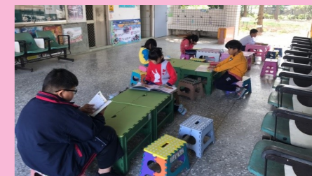
二甲 行動書車 快樂閱讀