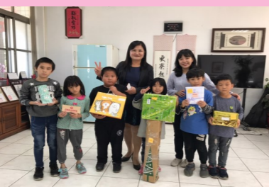
兒盟寄送聖誕禮物