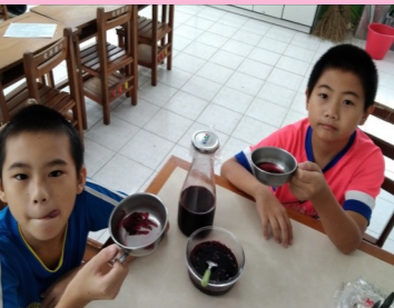
五甲 愉快的洛神花茶時間