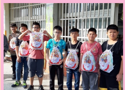
六甲 聖誕禮物來囉！