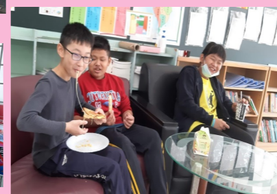
六甲 熱壓土司-牽絲囉！