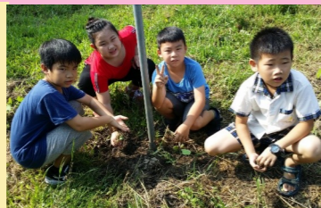
三甲 大家一起來種菜

最令我難忘的是親子趣味競賽，爸爸揹著我往終點跑，我們得到了第三名，領到了香皂，弟弟和媽媽玩滾呼圈的遊戲，領到了餅乾。校慶那天，我們玩得很開心，希望下次還可以再辦運動會。