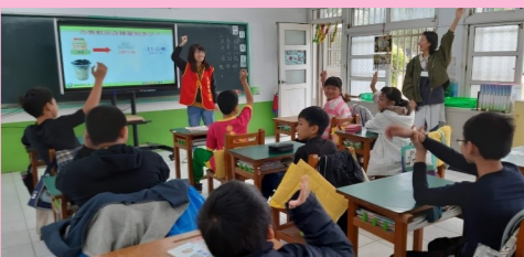
六甲 健康促進宣導