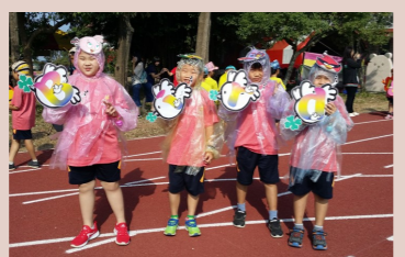
三甲 我是一隻小小鳥