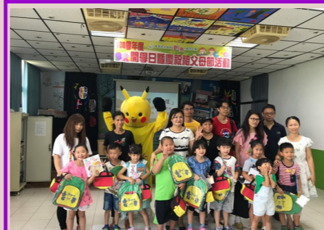
一甲 小一新生-贈書包與餐盒