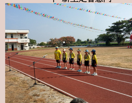
二甲 校慶創意進場