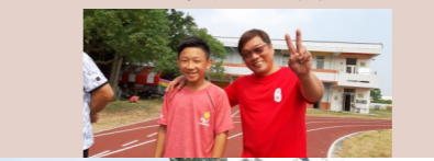
六甲 親子趣味競賽