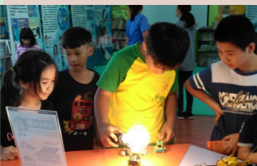
四甲 太陽能車體驗

我要靠自己努力完成這二個夢想，真希望我的願望能實現，不管能不能成功，我覺得能讓大家的生活過得更有興趣更精采，是一件讓我快樂的事。