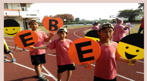
四甲 校慶創意進場