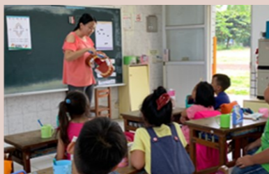
一年級洗手潔牙宣導(愛乾淨的好寶寶!)