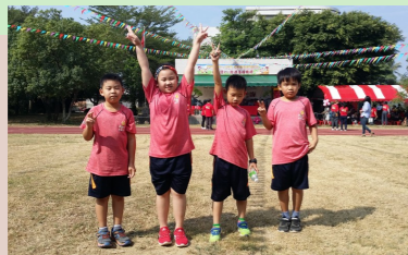
三甲 校慶生日快樂YA!

忙了好幾天的校慶運動會，現在總算圓滿順利的結束了，我好開心，也期待下次的校慶運動會趕快到來。