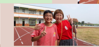
六甲 親子趣味競賽