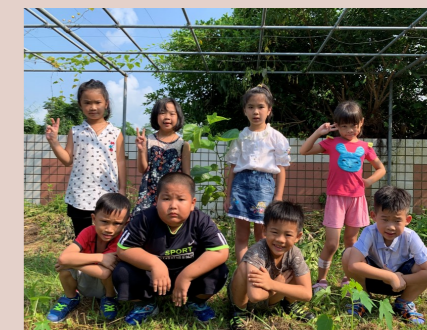
一甲 有機菜園前合影