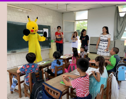
一甲 皮卡丘歡迎新生