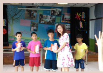
四甲 繪本比賽全國第二名