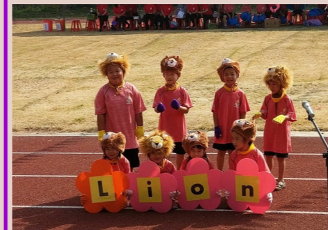
一甲 校慶 - 可愛的獅子