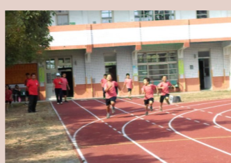
四甲 校慶六十公尺比賽