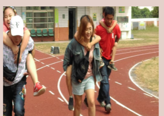
四甲 校慶親子趣味競賽