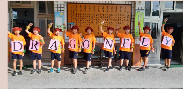
六甲 校慶創意進場