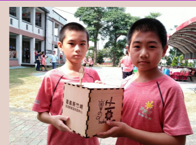
五甲 自造科技教育