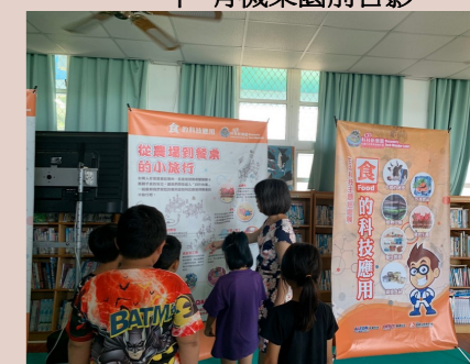
二甲 食的科技觀摩