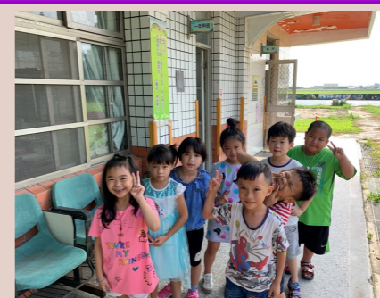
一甲 可愛的小一新生