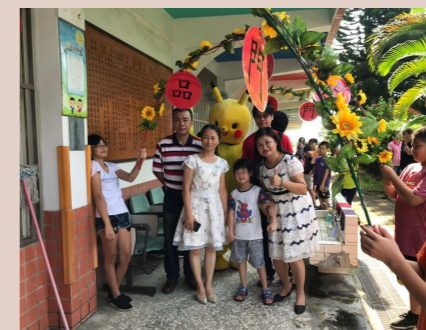
一甲 新生走智慧門