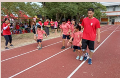
校慶親子趣味競賽(好有趣啊><)