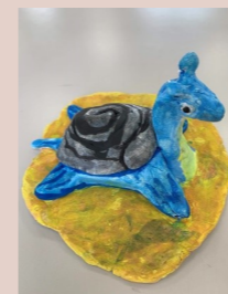
二甲 黃彥嘉 神奇寶貝 (乘龍)