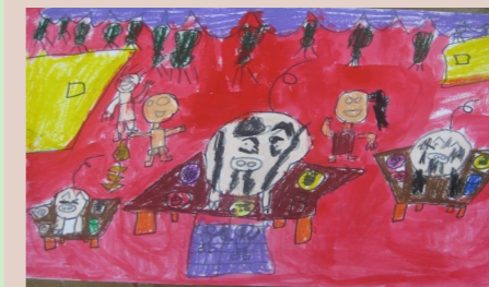
一甲 郭彥良 拜拜