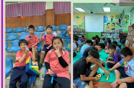
二甲 闖關獲得的玩具 一甲 空氣動力車教學