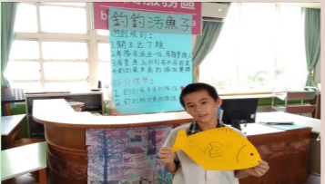
四甲 長庚科大宣導