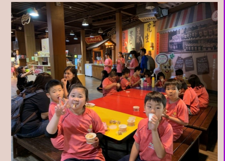
二甲 好吃的花生冰淇淋