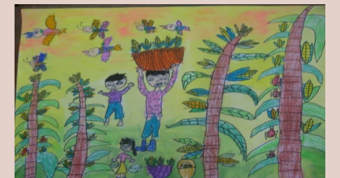
一甲 莊珮雯 採收玉米