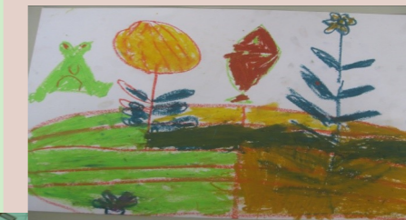
一甲 張奕瑄 花池