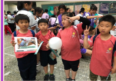
二甲 校外教學參觀—新港國中科學闖關