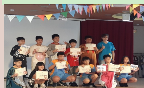
五甲 參加文光英語村營隊結業典禮

這禮拜有很多時候都必須用英文回答才能得分，這讓我很緊張，但也體會到「勇敢嘗試，終有收穫！」