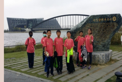
六甲 參訪故宮南院