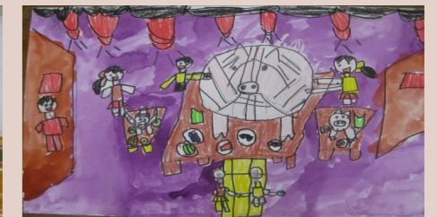
一甲 李胤滔 拜拜