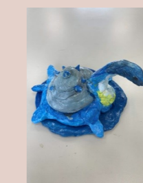
二甲 郭建緯 神奇寶貝 (乘龍)