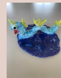
二甲 李彥偉 神奇寶貝 (暴鯉龍)