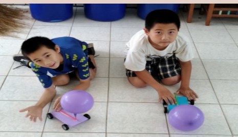
四甲 科學營DIY氣球跑車