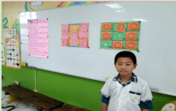
四甲 空污防治闖關