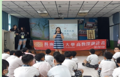
長庚科大空品宣導