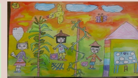
一甲 吳家儀 採收玉米

在老師的帶領之下，我們平安地回到學校，今天我們去了三個地方，每個地方都有滿滿的回憶，今天真是快樂極了！