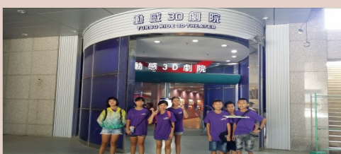
六甲 體驗動感3D劇院