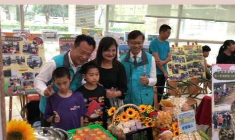
四甲 食農教育成果展

我的舅舅是我最喜歡的人了，因為他會買玩具給我，而且對我非常的好，等到小舅生日時，我要送他一個禮物謝謝他。