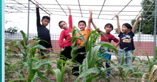
中年級 玉米長高了