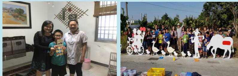
校長家庭訪問宣導親子閱讀