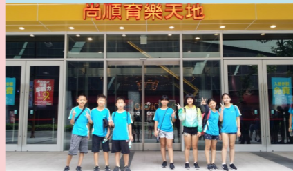
六甲 遊尚順育樂天地