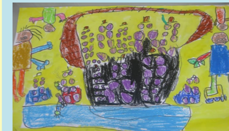
一甲 郭彥良 採葡萄