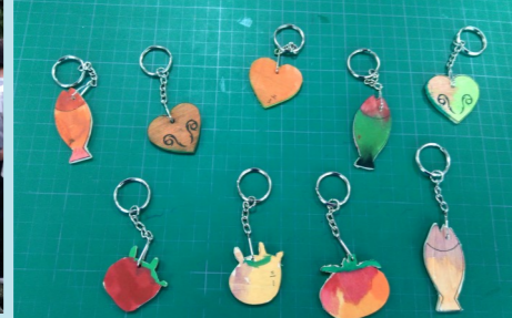
三甲 創意課程-鑰匙圈