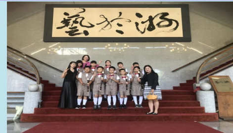
嘉義縣 107 學年度學生音樂比賽直笛合奏