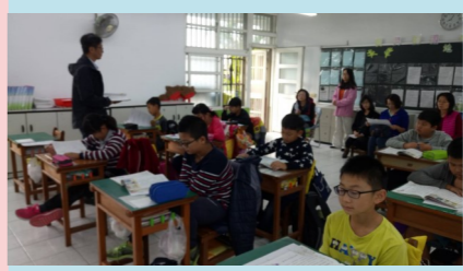
五甲 教授示範教學