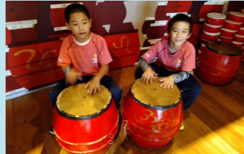
四甲 故宮南院-打鼓樂