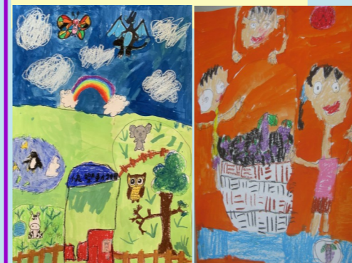
二甲 黃彥嘉 快樂動物園