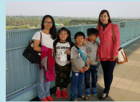
二甲 微電影比賽-上台北領獎