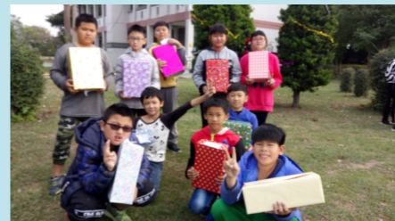
五甲 聖誕禮物來囉