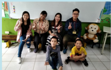
四甲 英語品格學院