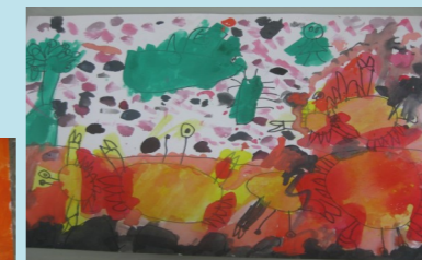
一甲 陳柏任 抓螃蟹