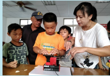
三甲 創意課程-切割模型

雖然有時貓咪會調皮搗蛋，惹我生氣，但有時可愛的模樣，也會讓我捧腹大笑。貓咪就像我的家人，也是我的最佳玩伴。