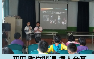
四甲 數位閱讀-達人分享