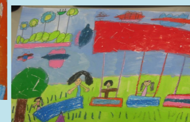
一甲 莊珮雯 燙秋千