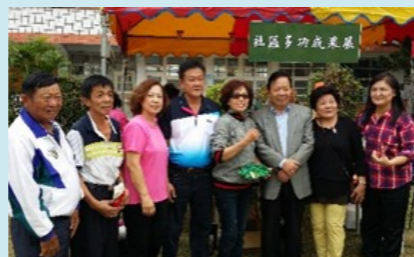
我蚵以敲古更暨我嘉本土饗宴- 鄉長到場指導