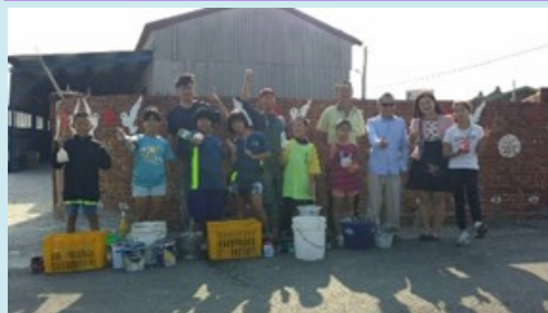
校長帶五甲小朋友參加社區彩繪