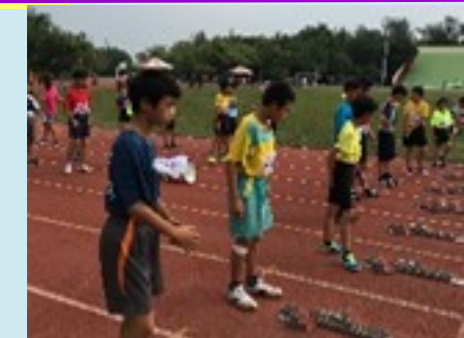
小朋友參加師生田徑賽