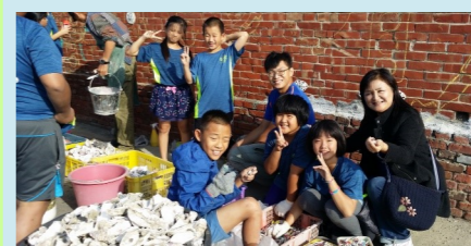
五甲 蚵牆彩繪樂陶陶