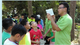
四甲 森活智多星活動 (1)