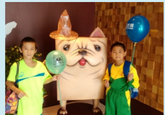
三甲 參訪老楊方城市