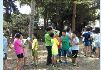
四甲 森活智多星活動 (2)