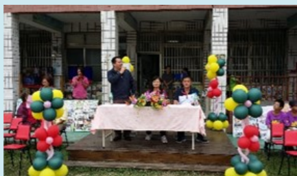
我蚵以敲古更暨我嘉本土饗宴- 副議長致詞

嘉義縣朴子市農會 銀行代碼：617 分行代碼：0024 學校專戶帳號：00024160094411 勸募許可文號：府教國字 第 1030219107-42 號