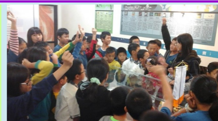
六甲 參觀藥物濫用防制中心

這次的戶外教學，我非常喜歡而且開心，因為讓我們學到毒品的危害，另外也讓我們了解方塊酥的製造過程，我希望以後可以到更多的地方學習更多的東西。