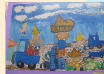
採高麗菜--二甲侯濯渝

秋天的風，最愛去旅行。到了兒童樂園，坐上雲霄飛車，快樂地往上衝；爬上摩天輪，慢慢地轉呀轉！