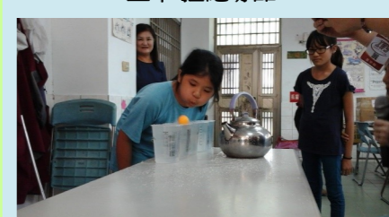
六甲 吹乒乓球比賽