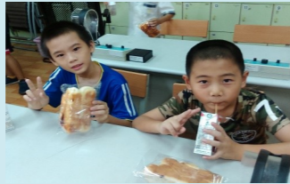
三甲 英語追風管點心時間