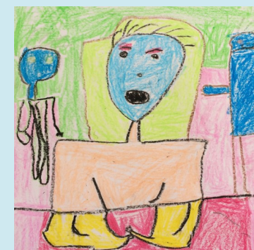
一甲 我的同學 郭建緯