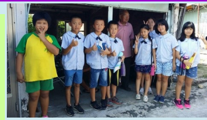
五甲 古林社區探訪