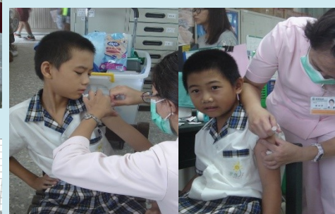
三甲 施打流感疫苗

我希望未來可以當有錢人，所以從現在開始，我要認真學習，將來努力賺錢，做一個有能力幫助別人的人。