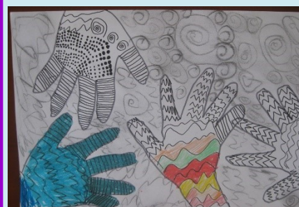
二甲 雙手萬能 余秉軒