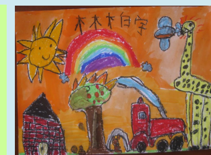
二甲 動物園 林柏宇