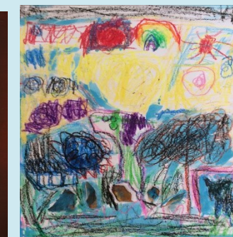
一甲 動物園 李資愷