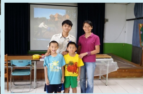
三甲 歡送替代役哥哥