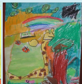
二甲 動物園 侯濯渝