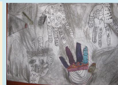
二甲 雙手萬能 林柏宇