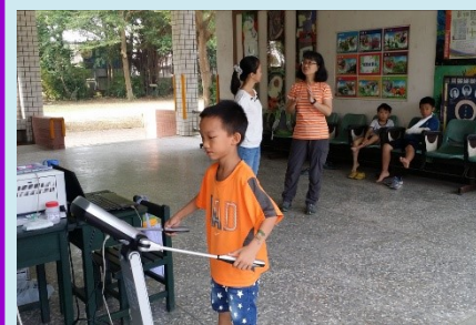
二甲 長庚體脂肪檢測

轟隆轟隆 轟隆轟隆 打雷了 嘩啦嘩啦 嘩啦嘩啦 下雨了 路上的行人 匆匆忙忙 趕著回家