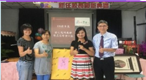
吳校長就任履新典禮