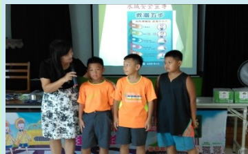
四甲 校長介紹轉學生