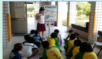
四甲 視力保健宣導