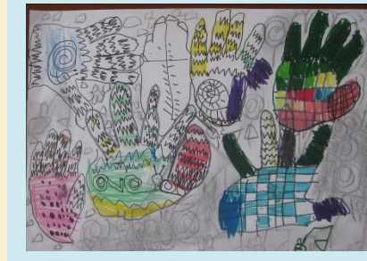
二甲 雙手萬能 侯濯渝