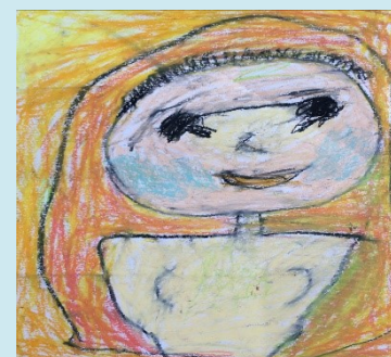
一甲 我的同學 邱澗瑩