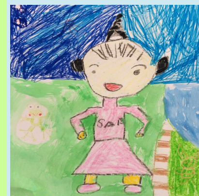
一甲 我的同學 黃彥嘉