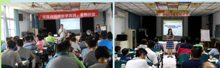
全縣學習共同體研習