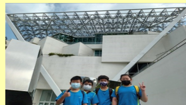
六甲 台南美術二館