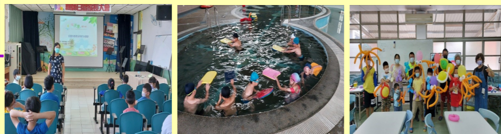
校長親自分享，食農教育與飲食健康 週五中、高年級游泳課 週六的親子母語共學講座