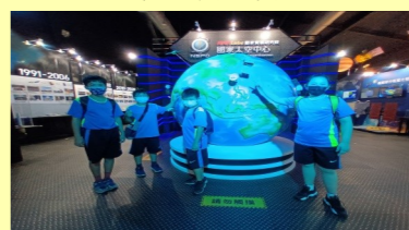
六甲 北回歸線太陽二館