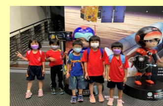
二甲 北回太空館之旅