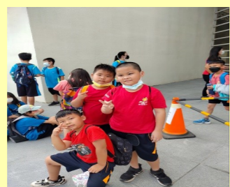
三甲 校外教學準備囉!