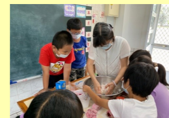
一甲 做洛神花饅頭 2