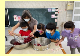
一甲 做洛神花蜜餞