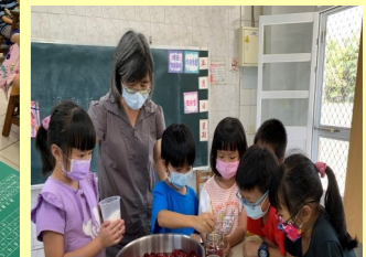
一、二甲 洛神花蜜餞裝罐