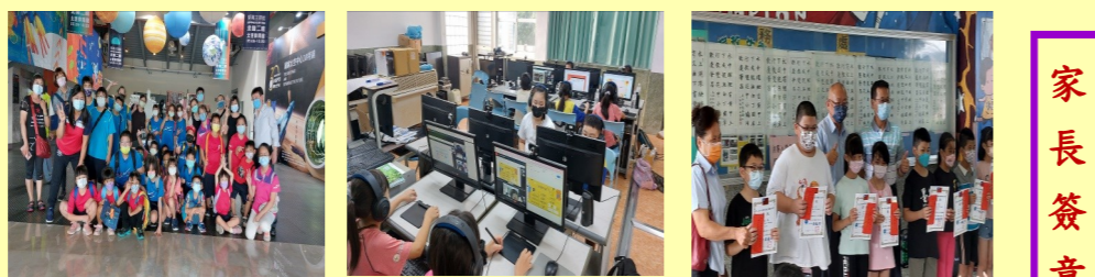
戶外教育-太陽二館參訪 數位學伴計畫-大手牽小手。起向前走 鉅祥盃全國書法比賽榮獲佳作