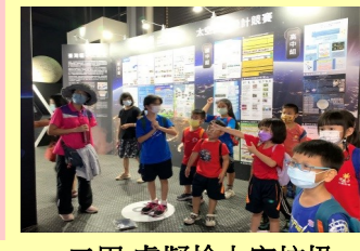
二甲 虛擬檢太空垃圾