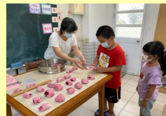
一甲 做洛神花饅頭 1