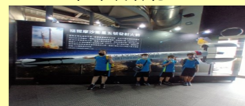
六甲 福爾摩沙衛星五號火箭