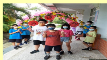
五甲 開學迎新活動