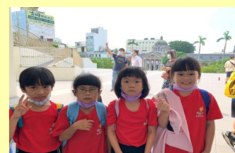
二甲 台南美術館之旅