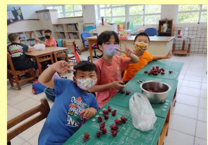
三甲 動手做洛神花蜜餞