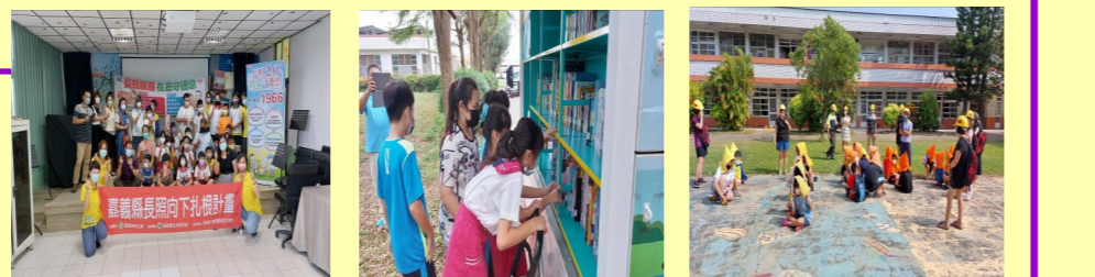
關懷長輩，長照向下扎根到校宣導 行動書車到校 每年 9 月 21 號的防震演練