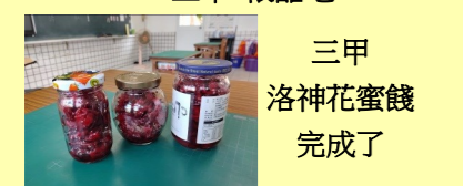
三甲 洛神花蜜餞 完成了