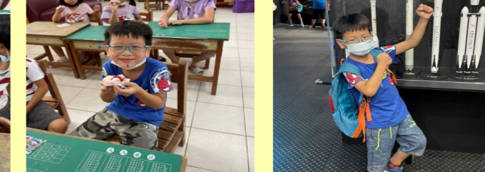
一甲 饅頭好好吃 2 一甲 校外教學

二甲科學教育(觀察落葉和新鮮的葉子) 一甲 我會說故事 1 一甲 我會說故事 2