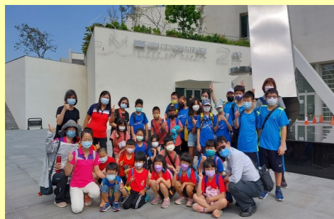
藝起來尋美-台南美術二館參訪