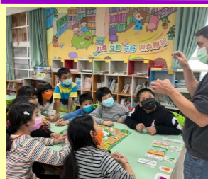
週二下午外師主題式英語教學

孩子們，天下無不散的筵席，再多的話語也不能表達校長對你們的關懷與不捨，學校透過各類的教育化育你們成材成仁，只希望你們要記得學校師長平日的教誨，時時以「更寮」（更新寮育造英才）為榮，刻刻以日行一善精神為懷，走在正確的道路。祝福你們在往後的人生道路上，鵬程萬里！前途似錦！