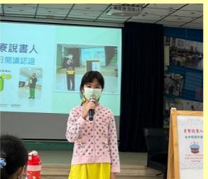
更寮說書人-生日閱讀認證