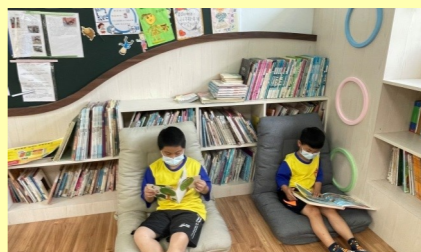
二甲 快樂的閱讀時間