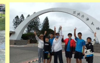
六甲 澎湖-跨海大橋