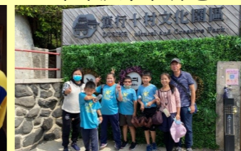
五甲 澎湖篤行十村