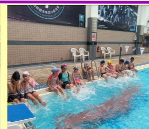
週五下午低年級繪畫社團-母親節卡片