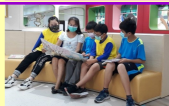
五甲 聆聽老師說故事