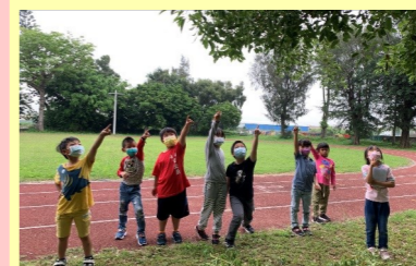
一甲、二甲 科學教育——認識校園植物