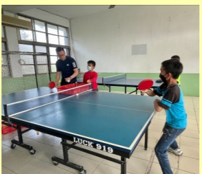
週三下午桌球社團