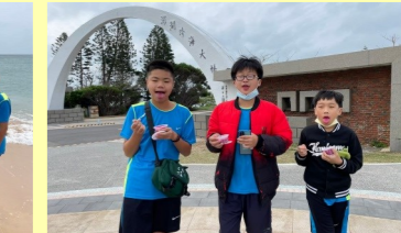
六甲 澎湖-仙人掌冰