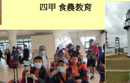
四甲 澎湖之旅-準備上船了