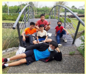
六年級校訂閱讀社區巡禮-故宮南院參訪