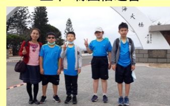
五甲 澎湖跨海大橋我來了