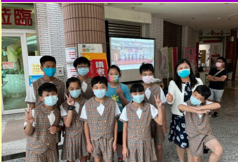
英語日學藝競賽勇奪好成績!