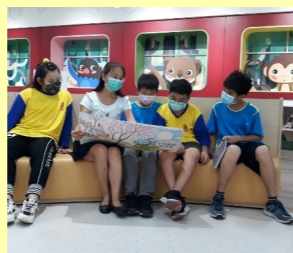
五年級校訂閱讀社區巡禮-縣圖參訪