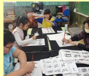
週三下午書法社團