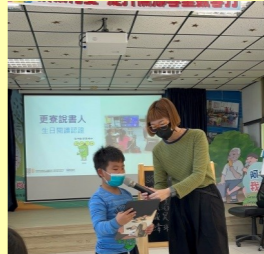
二甲 吳誠吳-更寮說書人