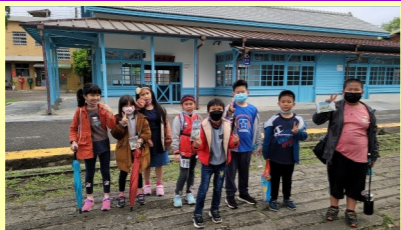
三甲 糖廠百年候車室

高速火車 快又帥氣的田徑好手 長長的車廂 像是長長的巨龍 每天來來回回的奔跑 為大家記載著更多 甜蜜的回憶