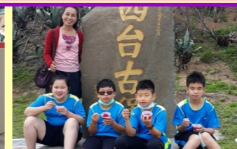
五甲 仙人掌冰 好吃！