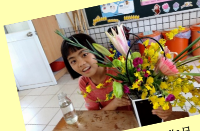
四甲 我的插花作品