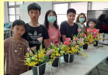
六甲 母親節插花活動