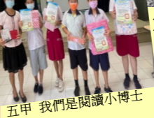
五甲 我們是閱讀小博士