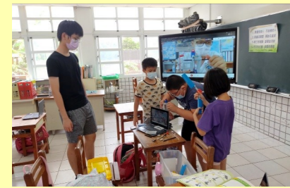
四甲 科學教具組裝