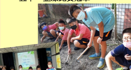
六甲 校本課-種玉米