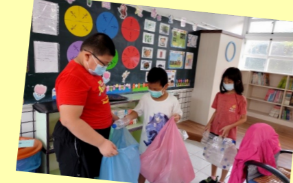
四甲 收集積水容器