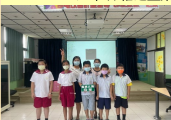
五甲 整潔比賽冠軍