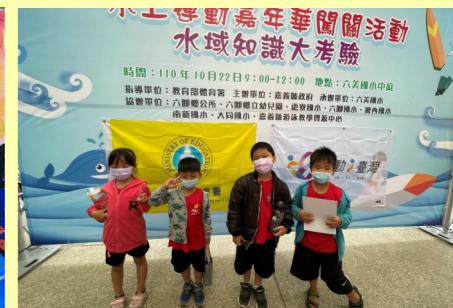
二甲 參加水上嘉年華活動