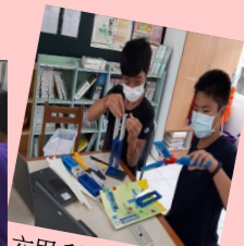
六甲 科學教具組裝