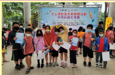
三甲 水上嘉年華闖關活動