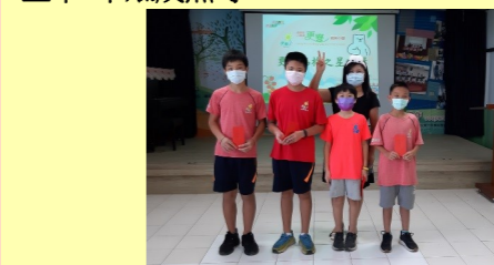
六甲 品格之星集點頒獎