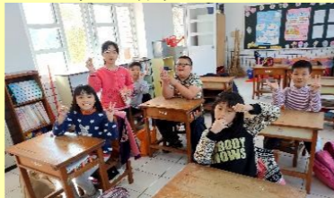
三甲 越南點心分享