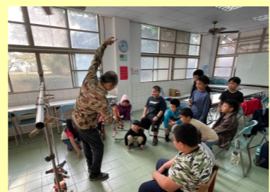
懸絲木偶營木偶操作練習