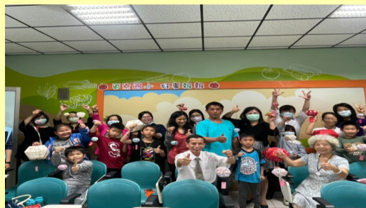
親職講座-手作天燈體驗