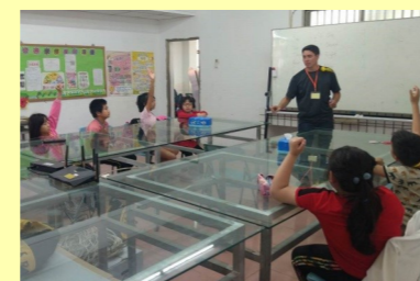
週二外師進行英語主題式會話教學