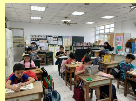
二甲 親師生齊閱讀