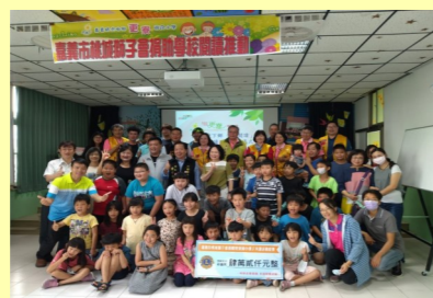
桃城獅子會樂捐助學