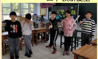
四甲 最佳男女主角