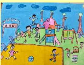
三甲 在公園玩--李胤滔 三甲 親愛的家人--吳家儀