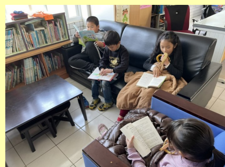
二甲 悠閒地坐在閱讀角享受寧靜時光