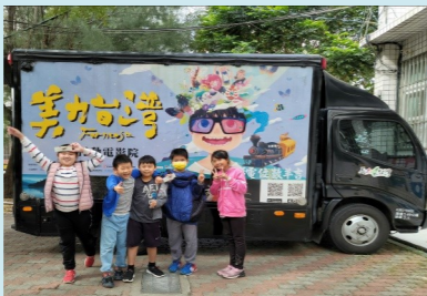
四甲 美力台灣3D電影展