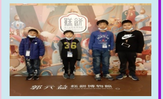
五甲 見學之旅-郭元益