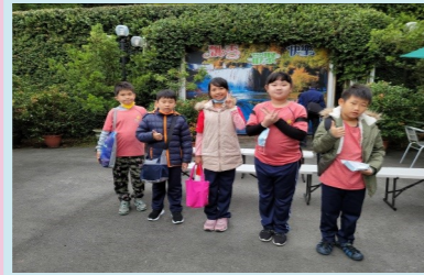
四甲 巴登咖啡參訪趣