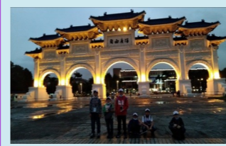
中正紀念堂-自由廣場