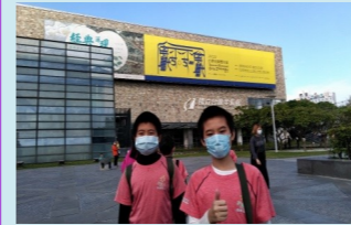
六甲 台中國立美術館