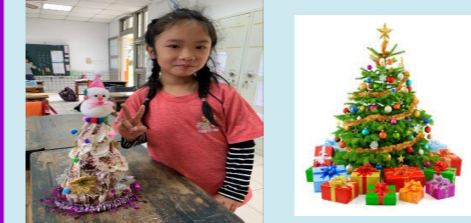
二甲 和媽媽一起完成創意聖誕樹