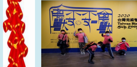
四甲 臺中美術館參訪趣