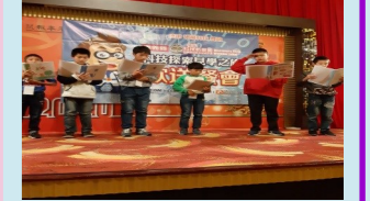
五甲 見學之旅-晚會表演