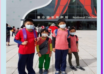
五甲 臺中國家歌劇院