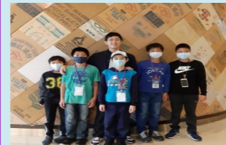
研揚科技見學之旅